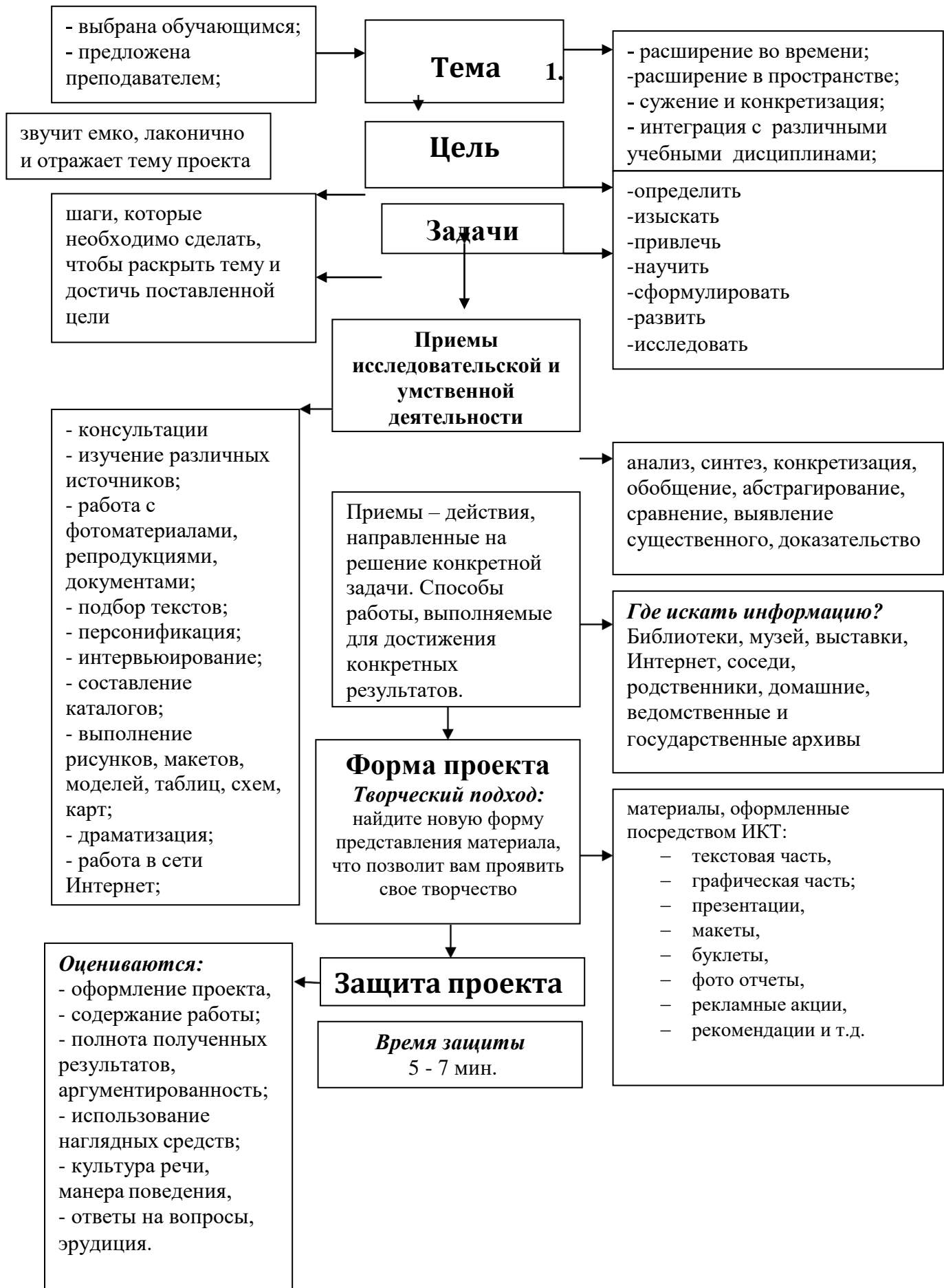
Рис. 1. Работа над индивидуальным проектом